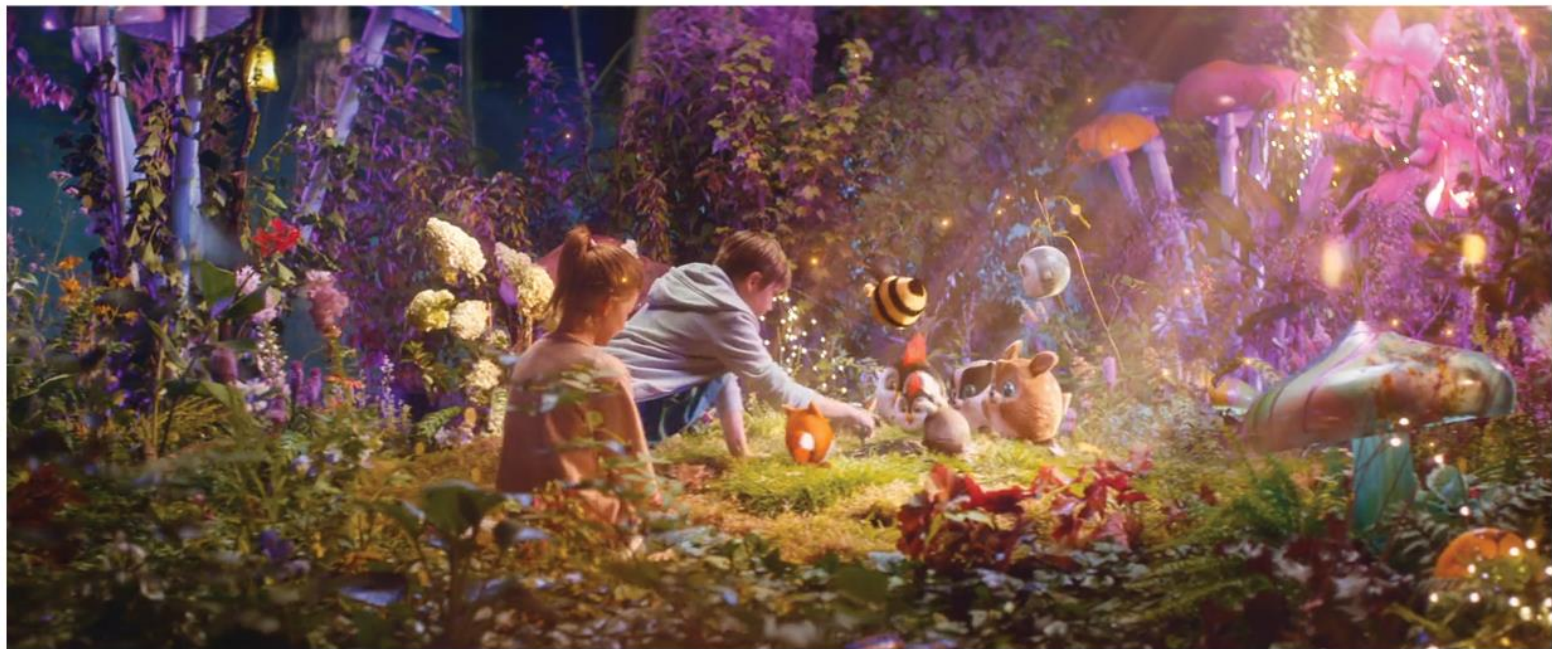
BIEDRONKA GANG SŁODZIAKÓW