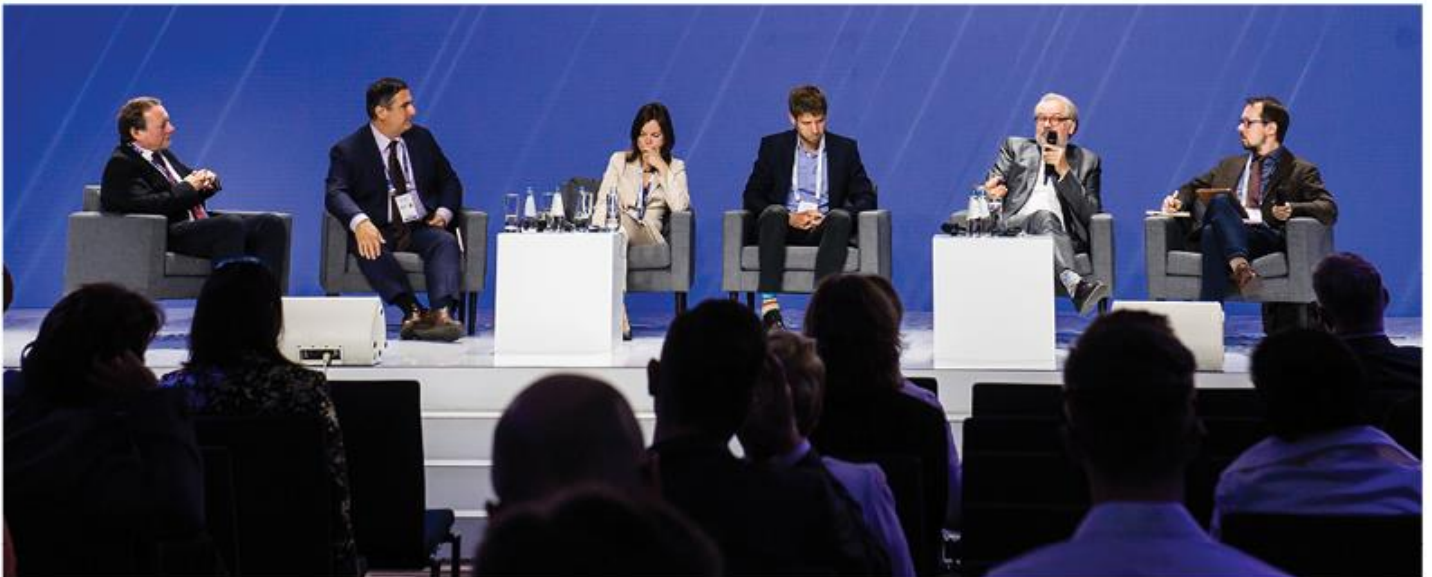
EUROPEJSKIE FORUM NOWYCH IDEI 2019