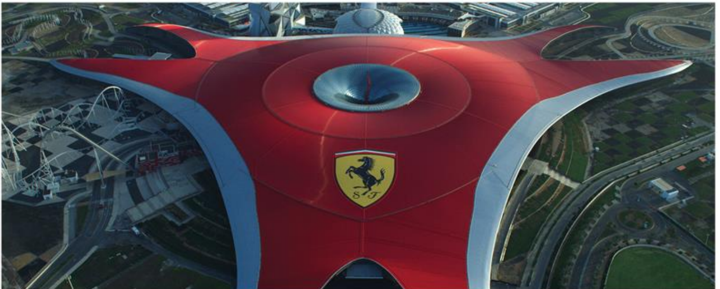
FERRARI WORLD ABU DHABI