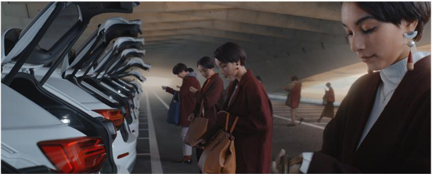
AUDI Q2 INFINITE LINE OF POSSIBILITIES