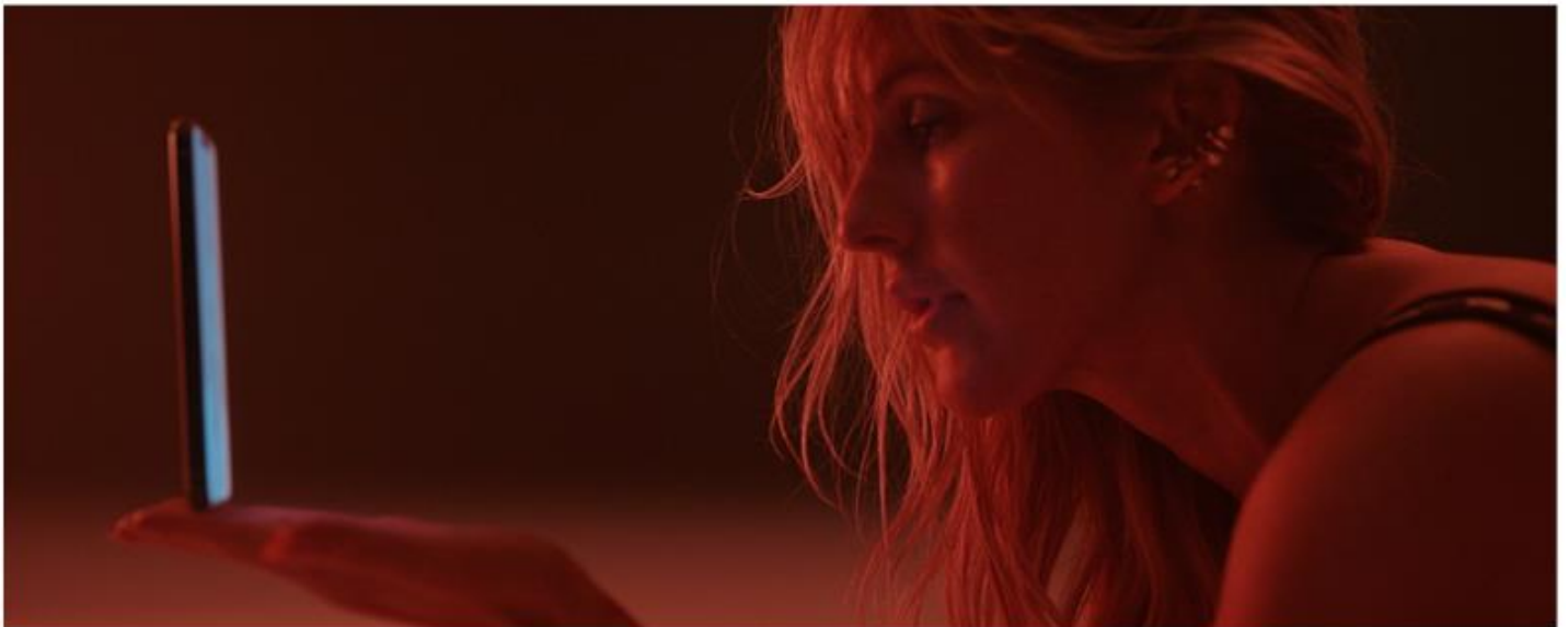
ELLIE GOULDING, JUICE WRLD "HATE ME"