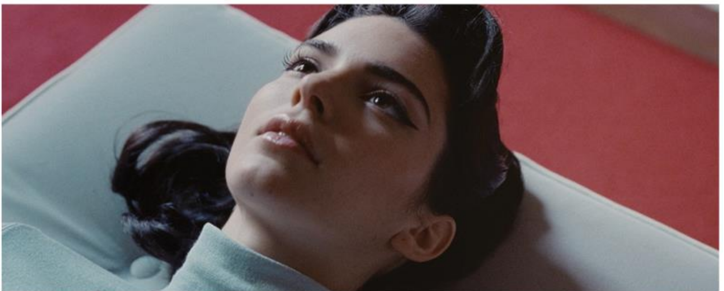
KENDALL JENNER X RESERVED #CIAOKENDALL