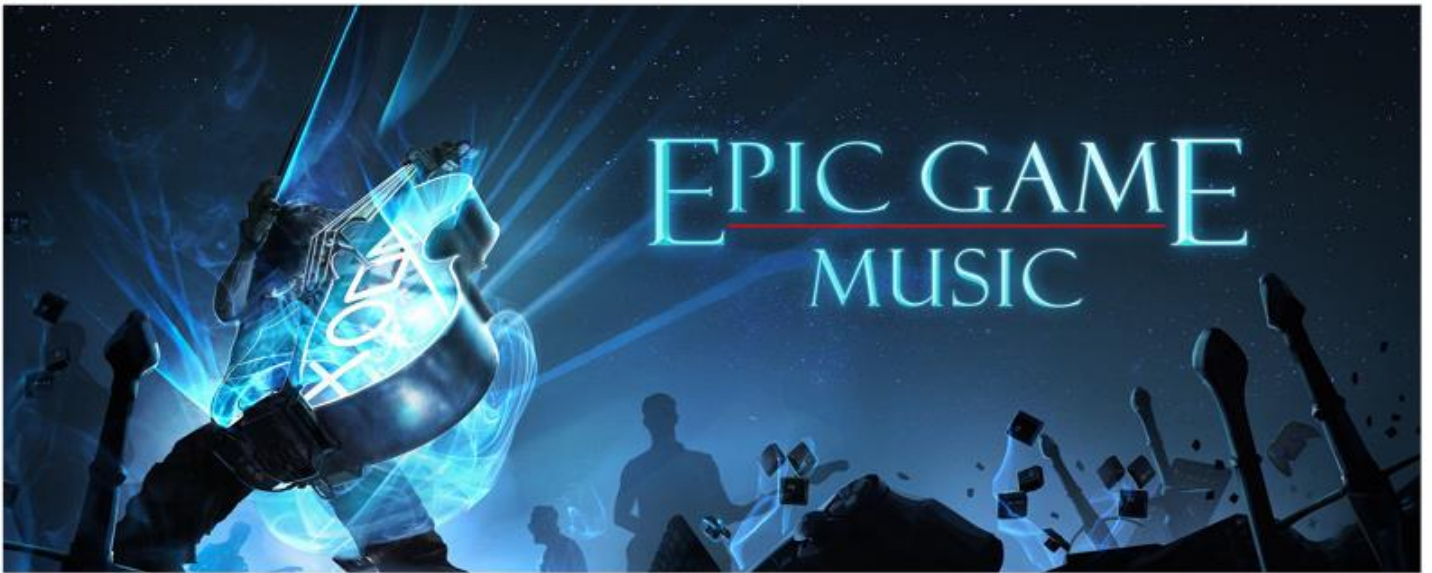
EPIC GAME MUSIC