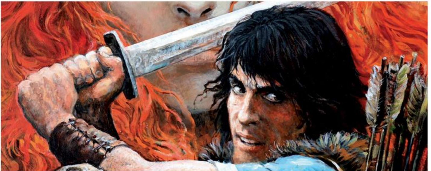
„ROSIŃSKI FANTASTYCZNY” ANIMACJA PLAKATU WYSTAWY