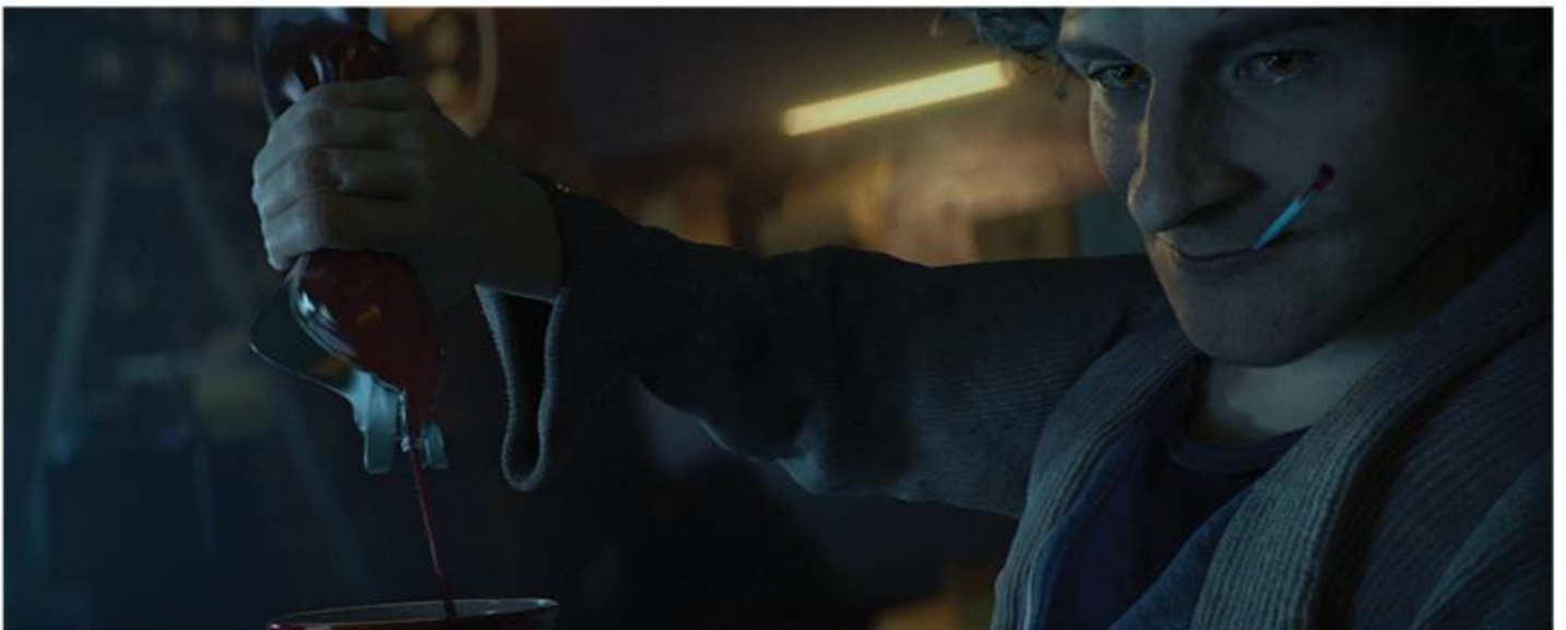
VAMPIRE: THE MASQUERADE – BLOODLINES 2