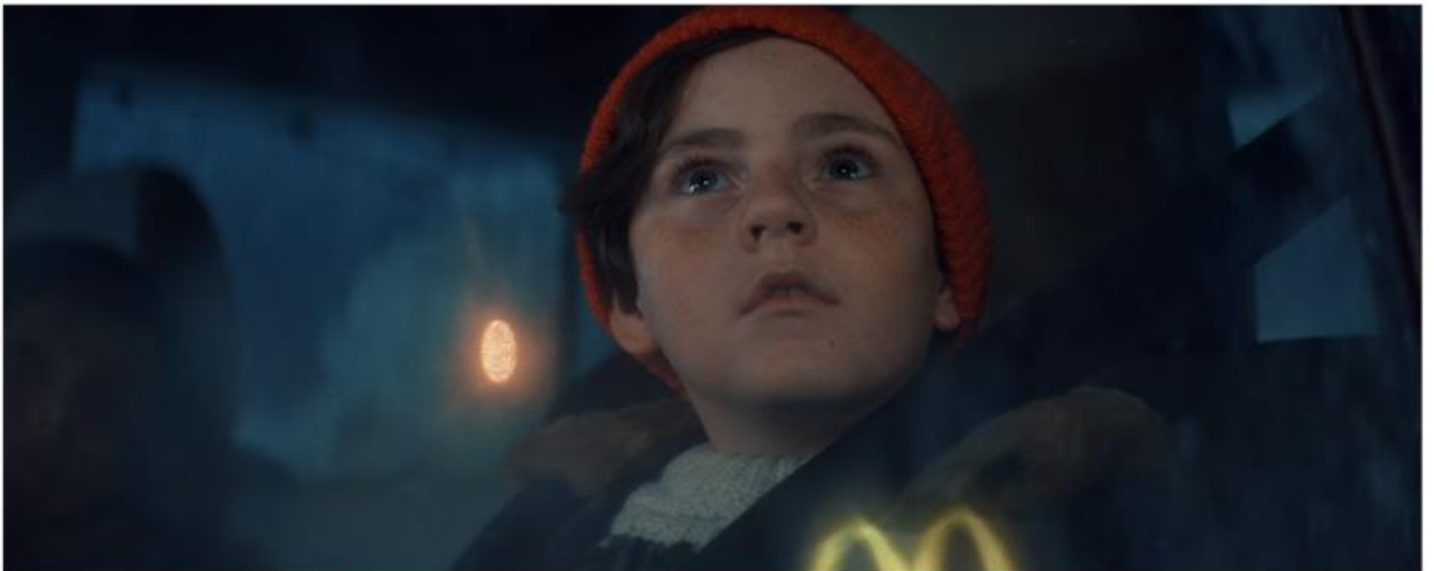
MCDONALD'S POLAND CHOINKA