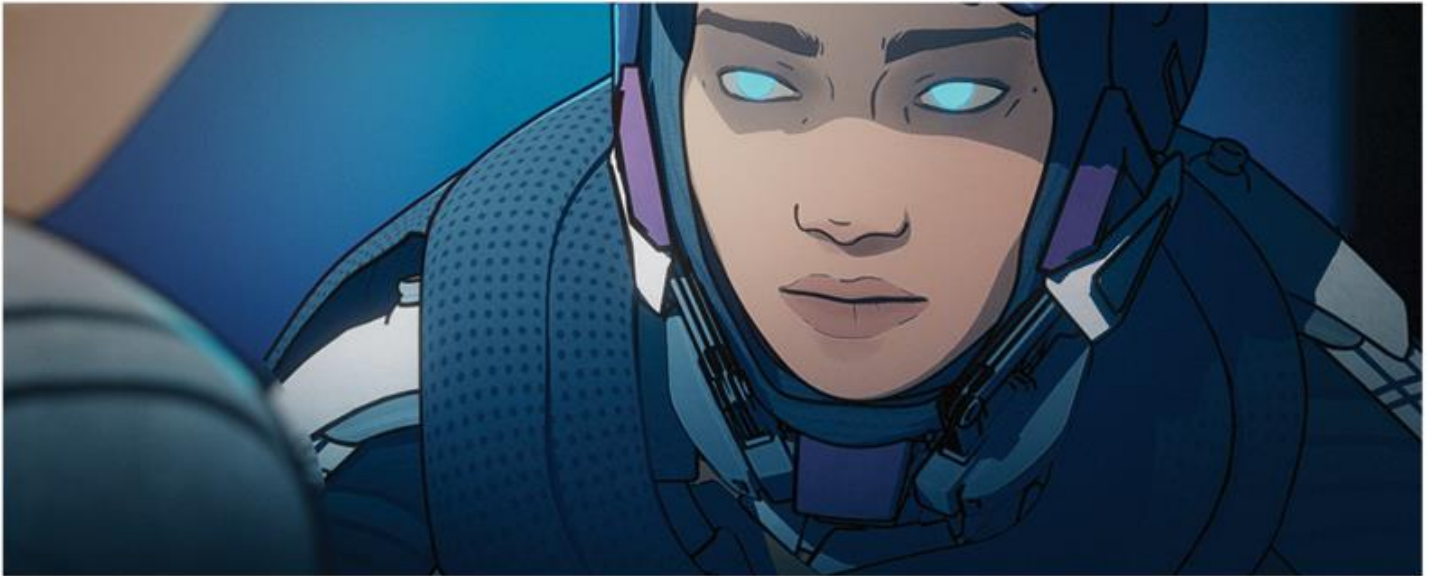
APEX LEGENDS | STORIES FROM THE OUTLANDS: „VOIDWALKER”