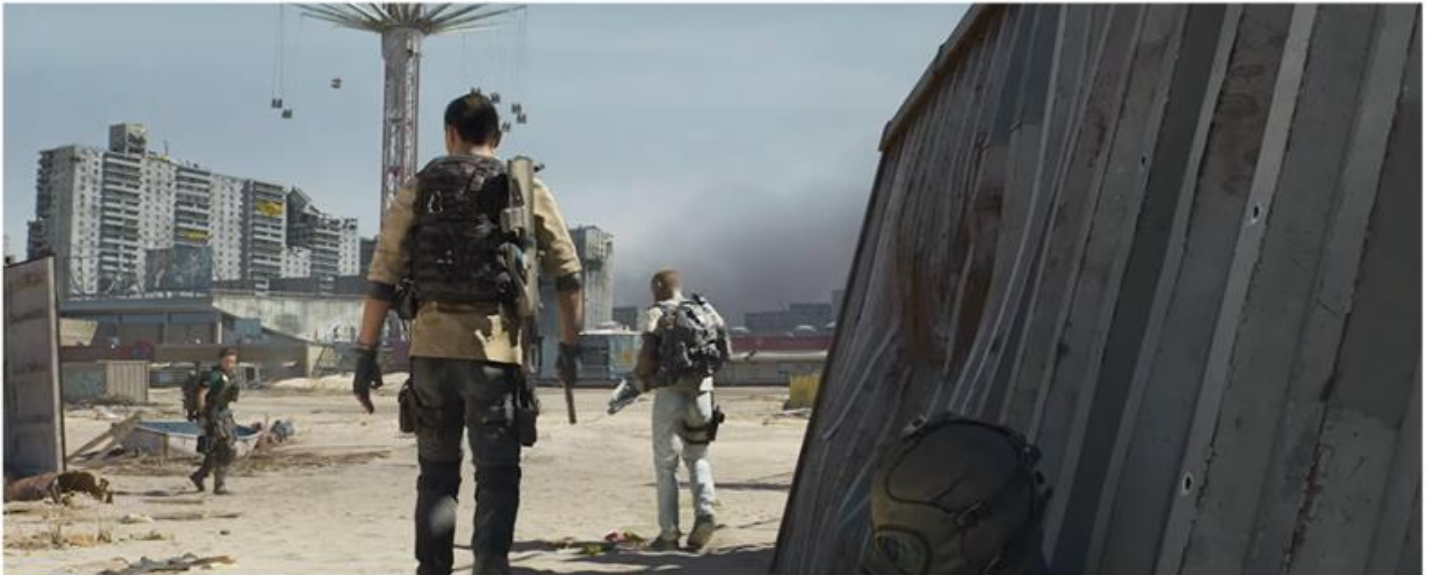
TOM CLANCY'S THE DIVISION 2: EPISODE THREE