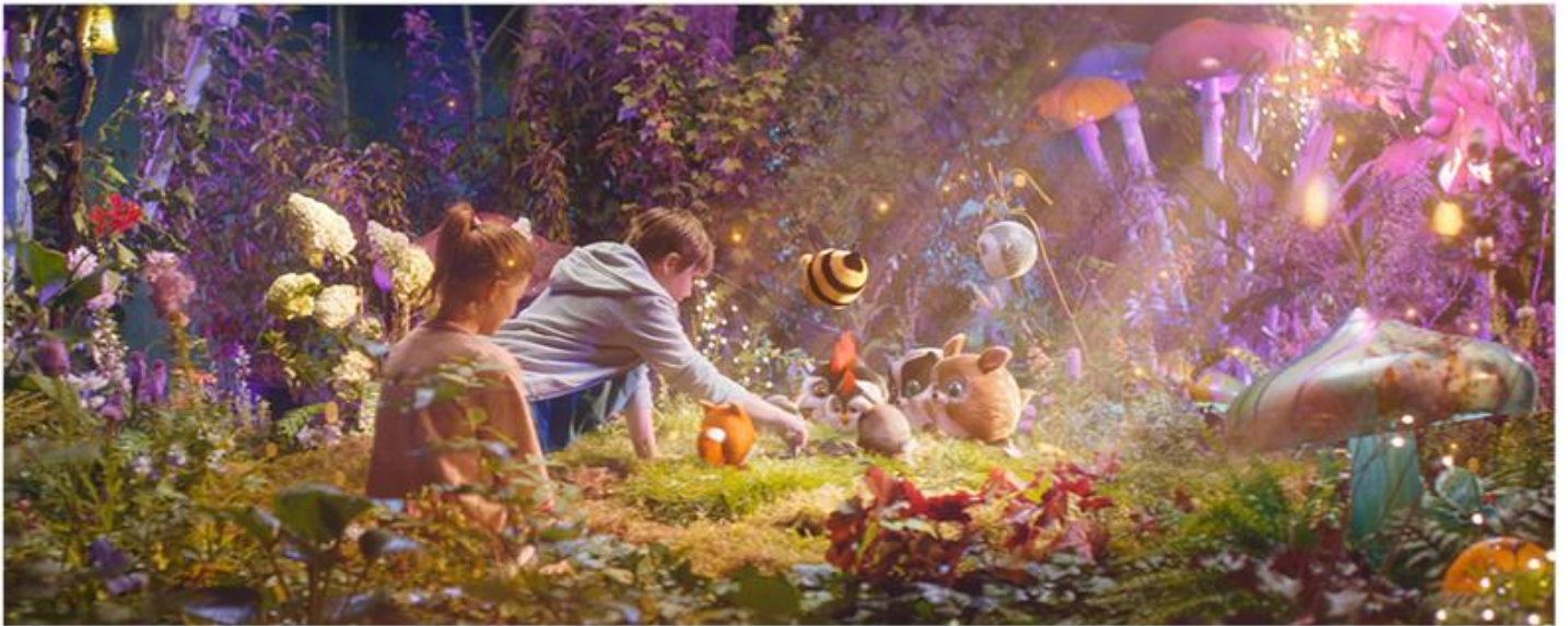
BIEDRONKA GANG SŁODZIAKÓW I MAGICZNY PORTAL