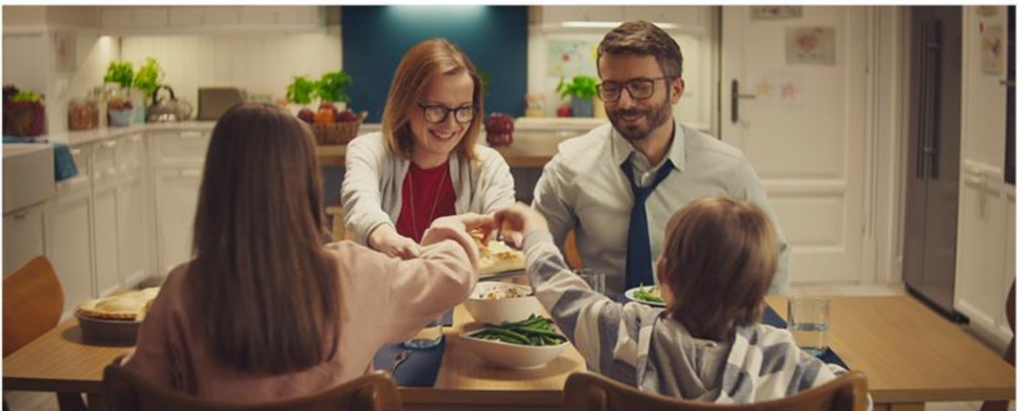
SCHWAN'S TV SPOT