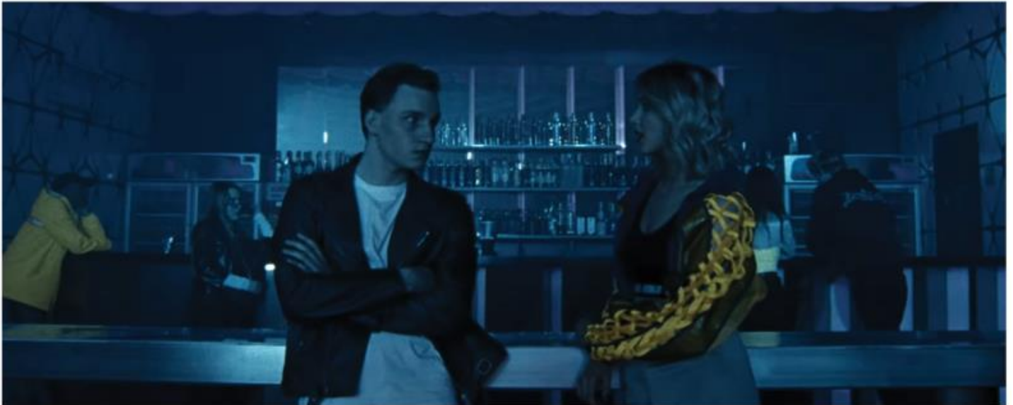
PEZET „OBRAZY POLLOCKA”