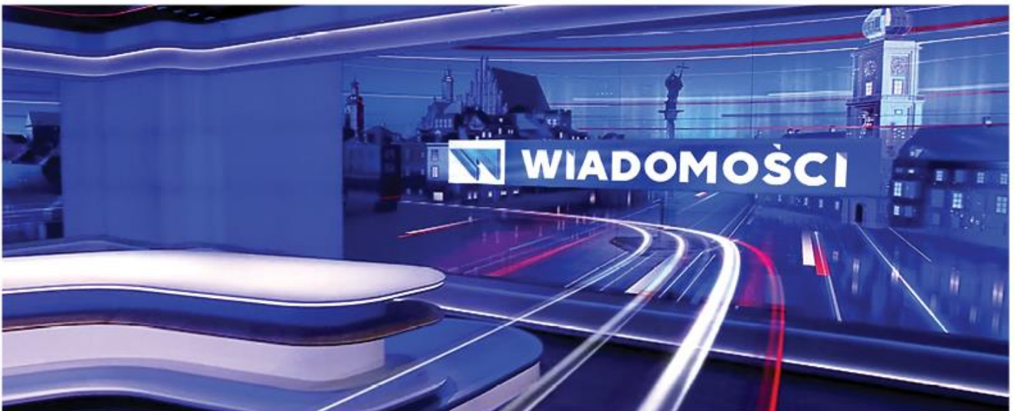
OPRAWA WIADOMOŚCI TVP