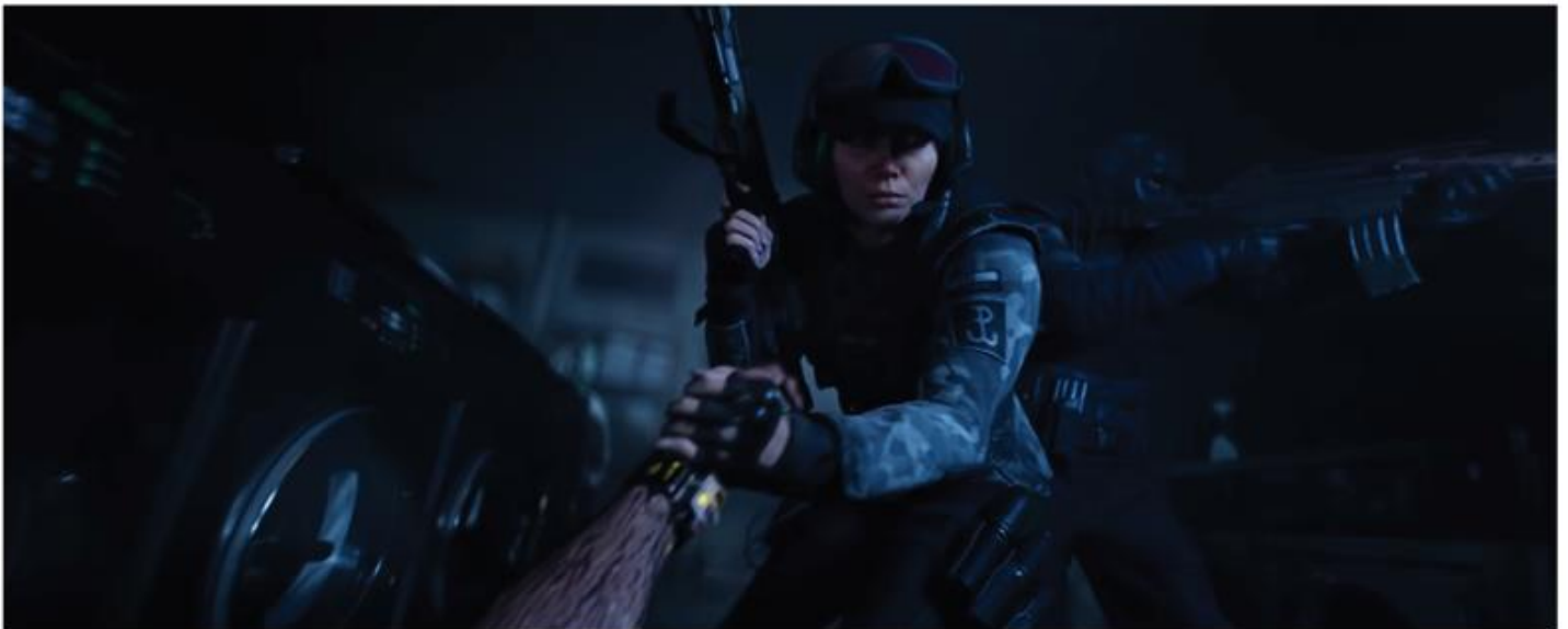
RAINBOW SIX QUARANTINE