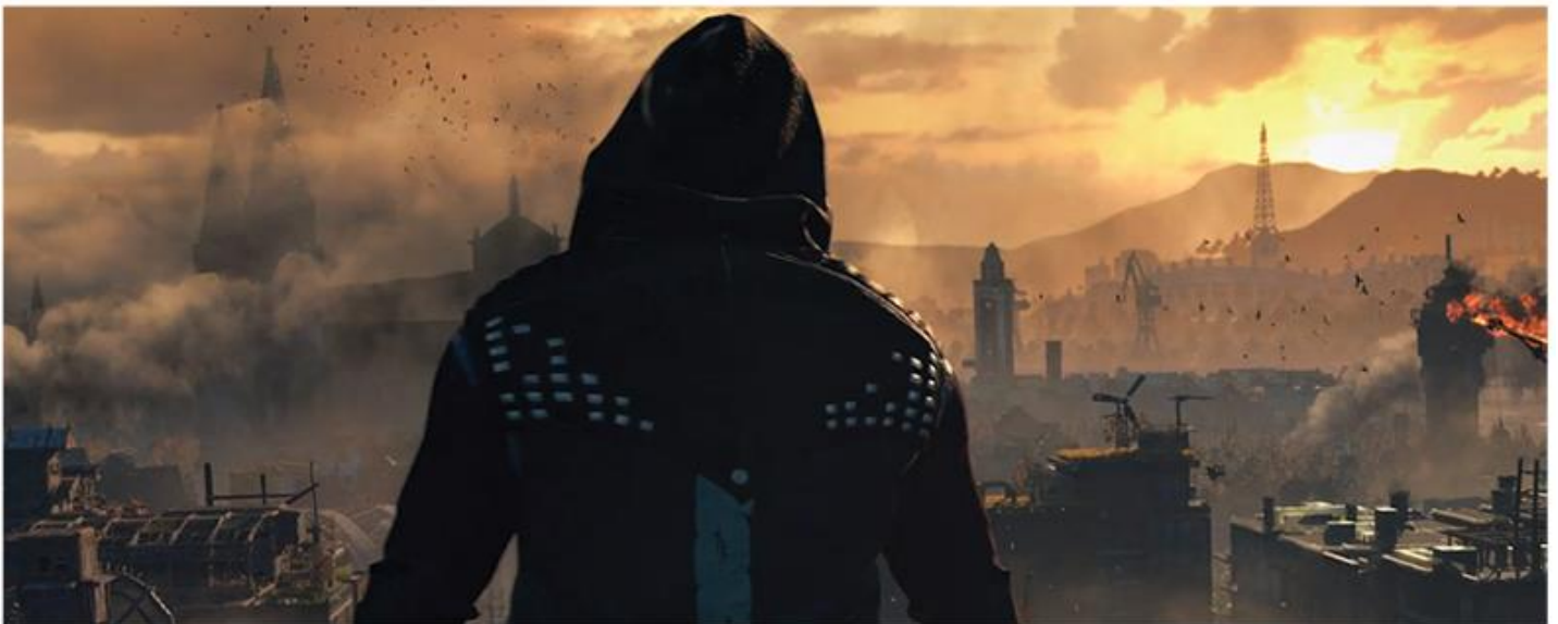
DYING LIGHT 2