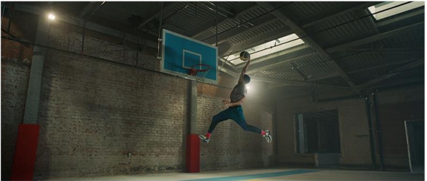
ONEPLUS 8 SERIES