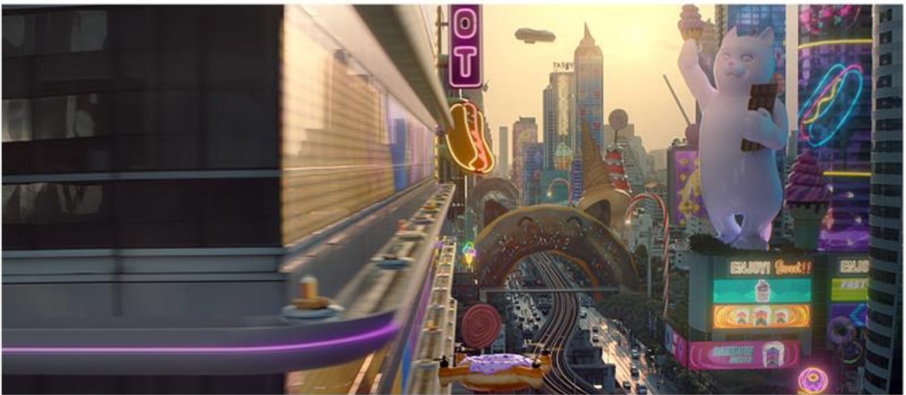
BABYBEL JOIN THE GOODNESS