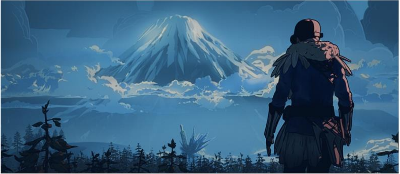
APEX LEGENDS | OBYCZAJE PRZODKÓW