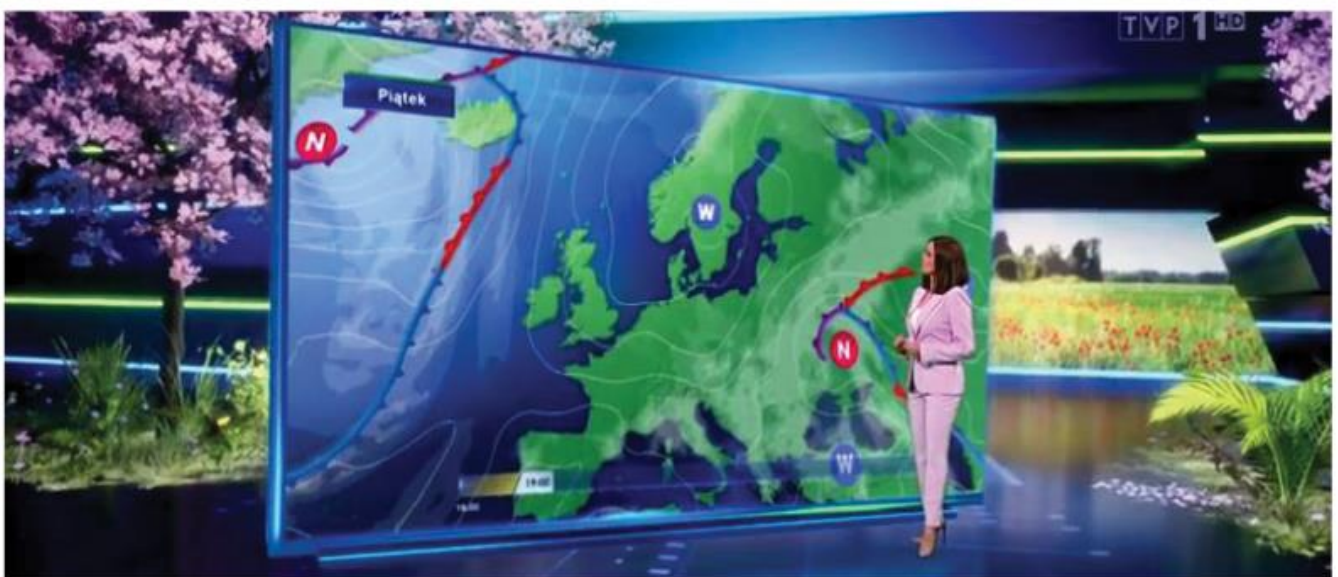
POGODA TVP WIRTUALNE STUDIO