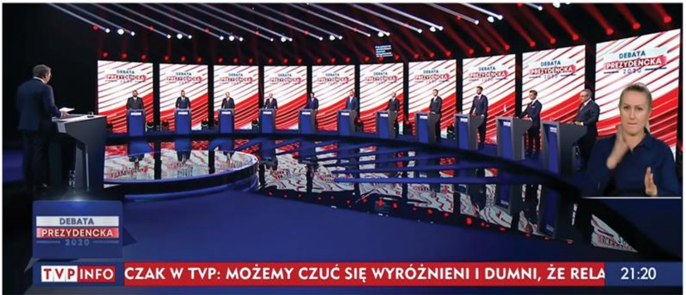
OPRAWA WYBORÓW PREZYDENCKICH DEBATA WYBORCZA