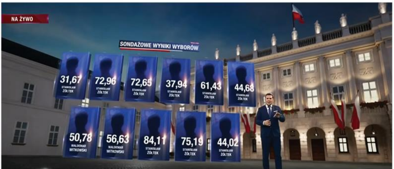
OPRAWA WYBORÓW PREZYDENCKICH STUDIO WYBORCZE