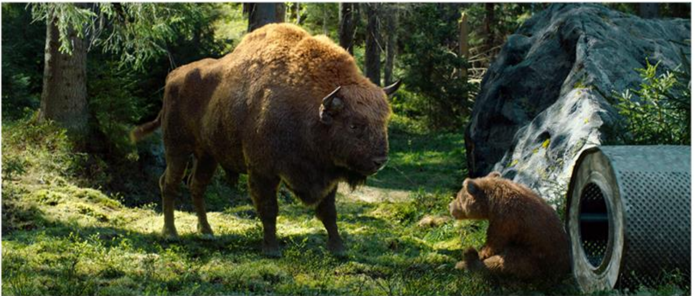
ŻUBR RATUJE ŻYCIE ZAGROŻONYCH GATUNKÓW