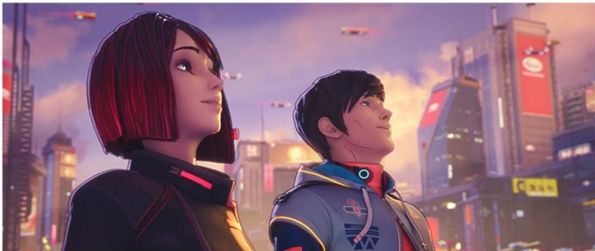
SASA | CYBERPUNK

Zespół Platige Image S.A. stworzył animowaną reklamę dla producenta przypraw z Indonezji. Stylizowany na anime spot został osadzony w cyberpunkowej estetyce. Żeby zrealizować wizję klienta Zespół Platige Commercial wykorzystał zarówno swoje doświadczenie jak i zaplecze technologiczne Spółki Platige Image S.A. Zastosowanie sesji motion capture pozwoliło znacznie usprawnić prace przy kolejnych etapach animacji. Od momentu premiery reklama zebrała ponad 6 milionów odsłon w serwisie Youtube .