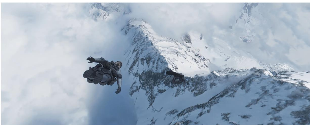
CALL OF DUTY®: BLACK OPS COLD WAR & WARZONE™ | SEASON 3

Zespół Platige Image S.A. przygotował animację do trzeciego i czwartego sezonu gry Call of Duty: Black Ops Cold War & Warzone , dystrybuowanej przez Treyarch Studios i Raven Software. Wszystkie animacje z serii są utrzymane w stylistyce nawiązującej do filmów akcji. Za reżyserię odpowiadał Damian Nenow, członek Amerykańskiej Akademii Sztuki i Wiedzy Filmowej.