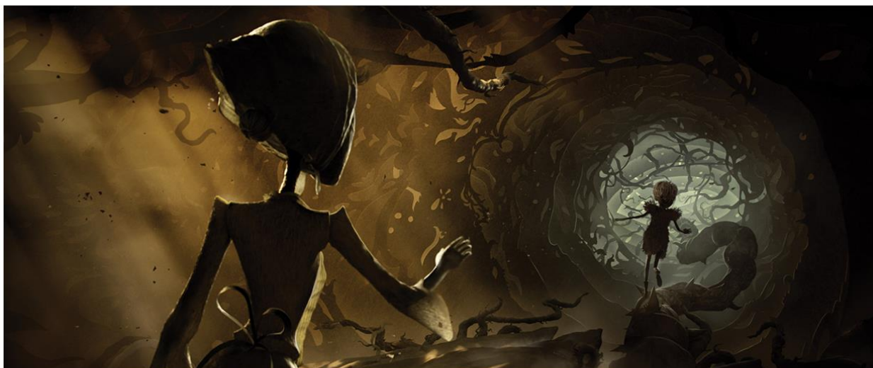
RESIDENT EVIL | VILLAGE

Zespół Platige Image S.A. stworzył krótką animację dla legendarnego studia Capcom, producenta i wydawcy takich tytułów jak Street Fighter , czy Devil May Cry . Za reżyserię i reżyserię artystyczną odpowiadał Jakub Jabłoński. Postacie wykreowane na potrzeby animacji stanowią alegoryczne odpowiedniki bohaterów gry Resident Evil Village , a opowieść odgrywa ważną rolę artystyczną w grze.