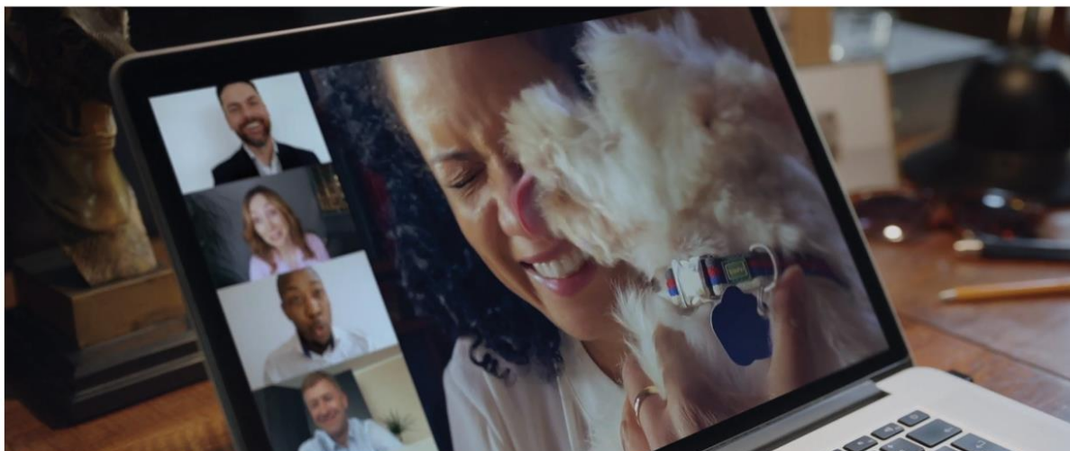
CAESAR | EATING TOGETHER

Zespół Platige Image S.A. zrealizował projekt dla londyńskiej agencji Alumina Studios. Platige Image S.A była odpowiedzialna za postprodukcję obrazu i dźwięku do spotu w reżyserii Julii Rogowskiej. Gwiazdami spotu są czworonożni aktorzy promujący karmę Ceasar. Głosu użyczyli im brytyjscy aktorzy.