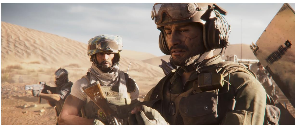
CALL OF DUTY®: BLACK OPS COLD WAR & WARZONE™ | SEASON 4