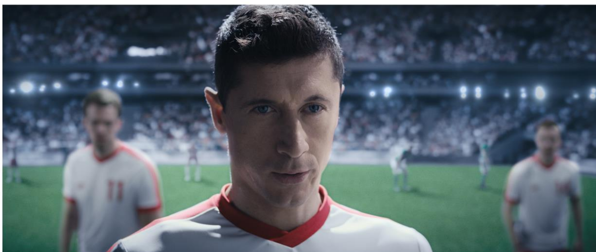
LOTTO | 65-LECIE TOTALIZATORA SPORTOWEGO