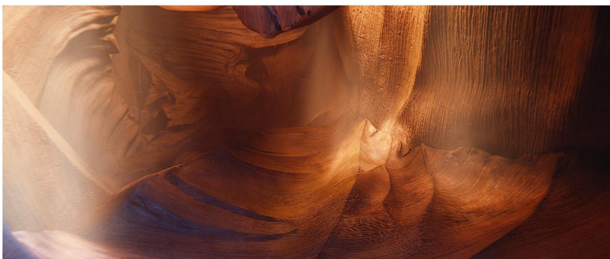
OTEX | EXPRESS

Platige Image S.A. stworzyła w pełni komputerowo wygenerowany spot reklamowy dla Agencji Bray Leino produktu Otex, oraz odpowiadała za postprodukcję dźwięku. Owocem współpracy artystów studia z reżyserem Jon Yeo jest zachwycający spot, bazujący na podobieństwie skalnego tunelu do wnętrza ludzkiego ucha.