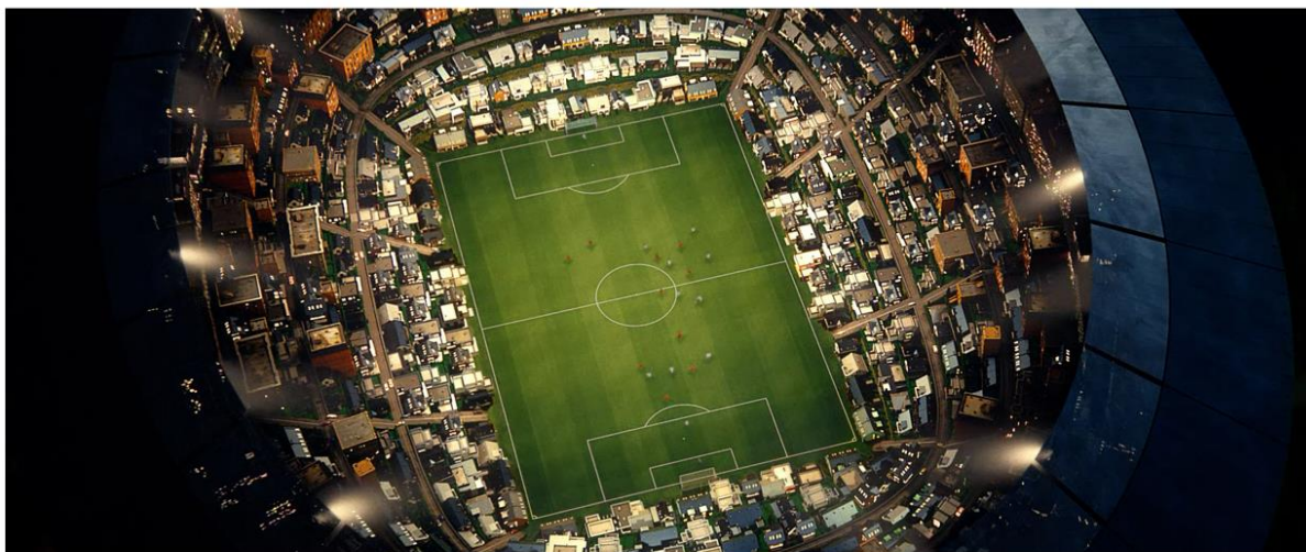
SAMSUNG | BRING THE STADIUM TO YOUR HOME

Platige Image S.A. współtworzyła spot reklamowy dla marki Samsung. Skierowany na rynek niemiecki projekt powstał we współpracy z E+P Films GmbH, agencją kreatywną Cheil Germany i Studiem MPC. Zespół Platige Image S.A. odpowiadał za postprodukcję. Z uwagi na obostrzenia pandemiczne, każdy występujący w spocie piłkarz Bundesligi był nagrywany podczas oddzielnej sesji.