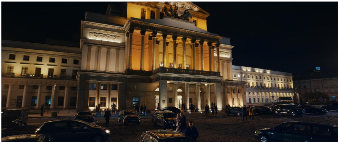
MCDONALD'S | SWOJSKI WIEŚMAC®

Zespół Platige Image S.A. odpowiadał za postprodukcję spotu telewizyjnego dla sieci restauracji McDonald's. Reklamę można oglądać również w serwisie Youtube, gdzie zebrała już ponad 1,5 miliona odsłon.