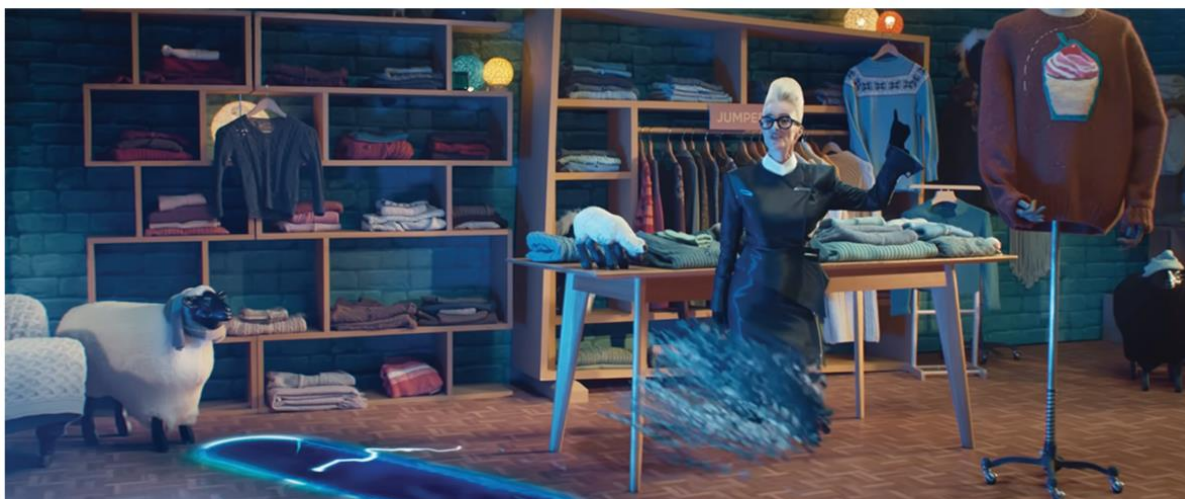
IONOS | I OWN THIS

Agencja brandingowa NOMAD, kreatywne studio produkcyjne Armoury London i agencja reklamowa 2050 London połączyły siły, żeby stworzyć postać, która stałaby się twarzą marki IONOS. Ekspert Platige Image S.A. odpowiadał za efekty wizualne i postprodukcję spotu. Reżyserem 40-sekundowej reklamy telewizyjnej jest Marc Sidelsky. Spot przedstawia niepokorną Ciocię Helgę i jej misję zrewolucjonizowania usług internetowych dla małych firm.