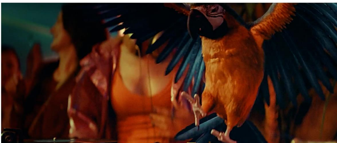
CAPTAIN JACK | HEY YO

Platige Image S.A. odpowiadała za postprodukcję spotu, dla jednej z marek Kompanii Piwowarskiej. Eksperti Studia stworzyli papugę CG, która jest brand character - Captain Jack. Jest to kolejna kampania dla marki, zrealizowana przez Studio Platige Image.