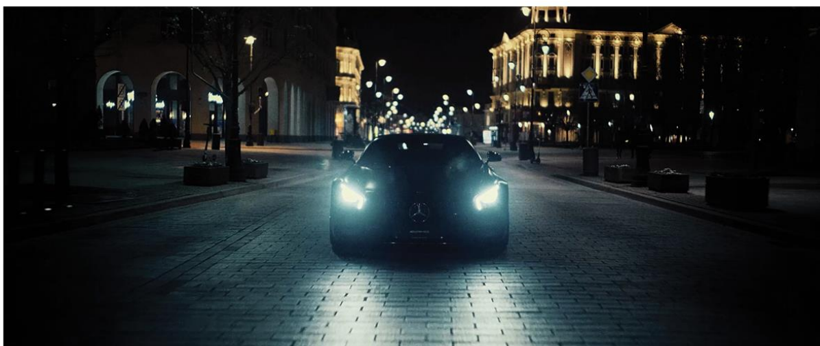
QUEBONAFIDE & TOMMY CASH | BENZ DEALER