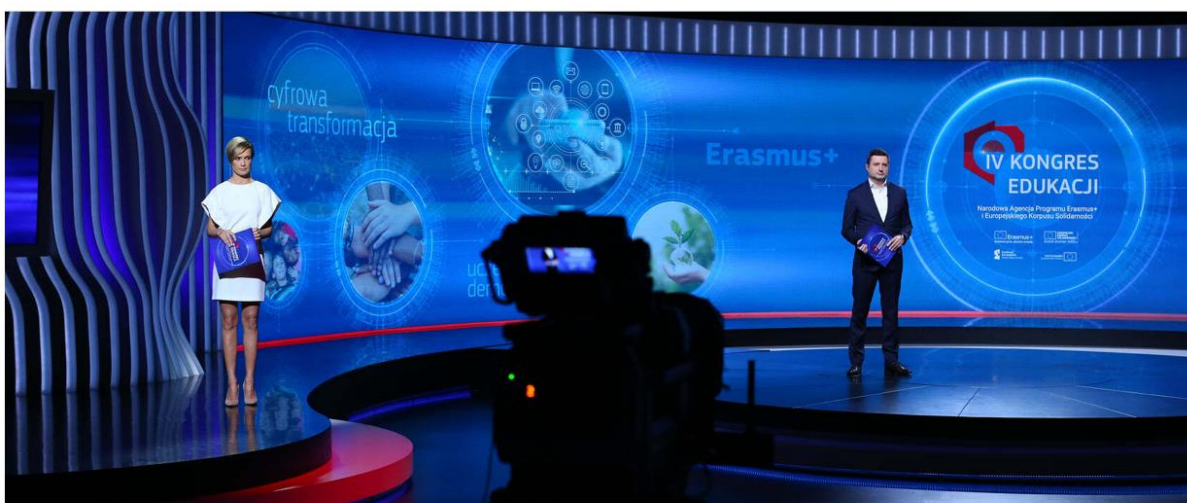
KONGRES ROZWOJU SYSTEMU EDUKACJI FRSE

Zespół Platige Image S.A. odpowiadał za oprawę graficzną Kongresu Fundacji Rozwoju Systemu Edukacji. Podczas trwającej trzy godziny produkcji zaprezentowano najnowsze rozwiązania technologiczne. FRSE zarządza programami, które umożliwiają poszerzanie wiedzy, zdobywanie nowych umiejętności i kompetencji na ścieżce edukacji, poprzez działania podejmowane w innych krajach oraz w społecznościach lokalnych.