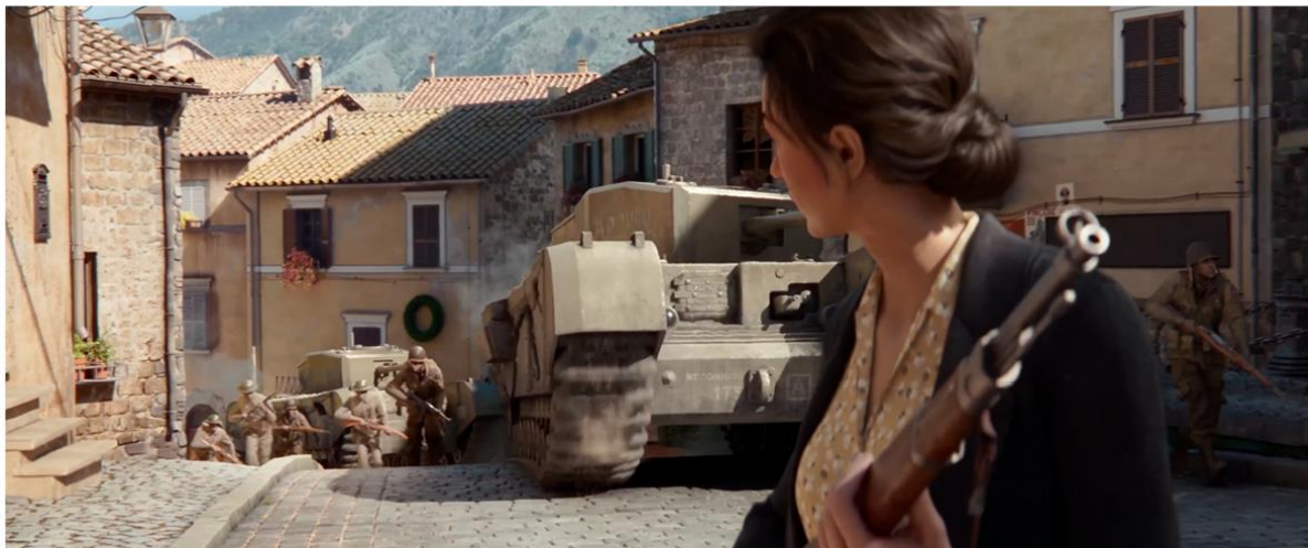
COMPANY OF HEROES 3

Studio Platige Image S.A. wspólnie z SEGA i Relic Entertainment przygotowało trailer CGI do gry Company of Heroes 3 . Na potrzeby zwiastuna, eksperci Studia stworzyli włoskie, nadmorskie miasteczko z okresu II wojny światowej. Animacja została oparta na nagraniach motion capture kaskaderów i aktorów w technologii FaceWare, która wiernie odwzorowuje ruchy twarzy. Dla zwiększenia naturalności użyto Steadicam jako wirtualnej kamery. Oprócz 25 modeli postaci, zespół animacji stworzył 15 różnych modeli broni oraz 5 różnych modeli pojazdów.