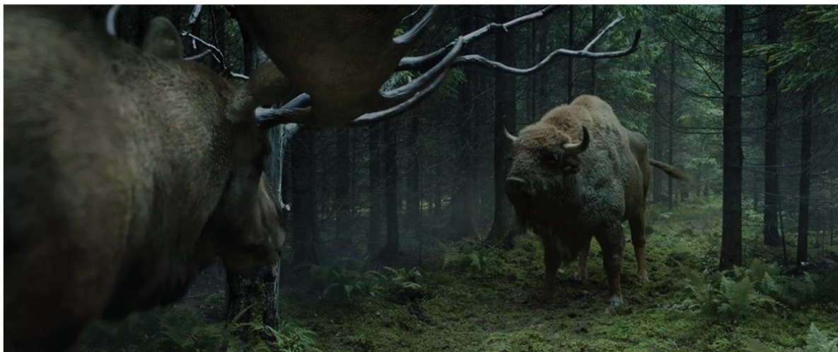
ŻUBR | KOMU POMAGA TWÓJ ŻUBR?

Zespół Platige Image S.A. przygotował kolejną odsłonę spotu dla Kompanii Piwowarskiej, producenta marki Żubr. Reklama ma na celu promocję i wsparcie akcji „Żubr ratuje życie zagrożonych gatunków” za pośrednictwem Funduszu Żubra Dla Przyrody. To inicjatywa, która skupia się na ochronie dzikiej natury w Polsce.