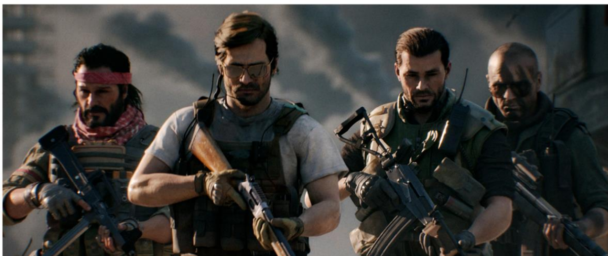
CALL OF DUTY®: BLACK OPS COLD WAR & WARZONE™ | SEASON 6