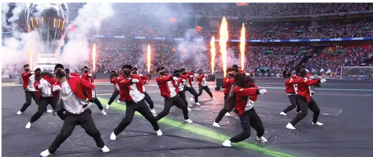
UEFA EURO 2020 | CEREMONIA ZAMKNIĘCIA

Platige Image S.A. była odpowiedzialna za kompleksową produkcję ceremonii zamknięcia finałowego meczu UEFA EURO 2020, między Włochami i Anglią. Oprawa została przygotowana we współpracy z londyńskim Events360, z wykorzystaniem technologii augmented reality i Spidercam. Wydarzenie odbyło się na stadionie Wembley w Londynie. To pierwszy projekt z użyciem technologii AR dla UEFA, przygotowany przez ekspertów Studia Platige Image S.A.