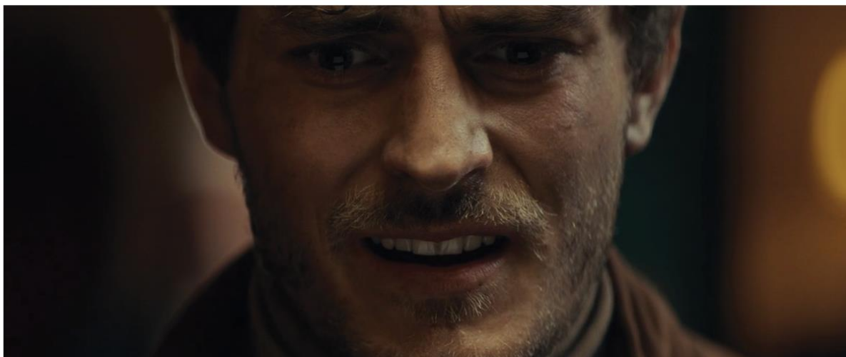
VIVALDI STABAT MATER

Zespół Platige Image S.A. był odpowiedzialny za postprodukcję teledysku do utworu Vivaldiego w wykonaniu jednego z najbardziej cenionych kontrtenorów - Jakuba Józefa Orlińskiego. Na potrzeby klipu eksperci Studia stworzyli m.in. postać realistycznego jelenia CG. Produkcją wyreżyserowanego przez Sebastiana Pańczyka klipu zajęło się Studio DOBRO. Światowa premiera krótkometrażowego filmu odbyła się na Warszawskim Festiwalu Filmowym.