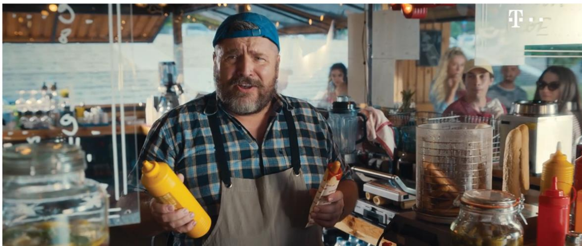
T-MOBILE | REAKCJE / SWAP

Dla operatora telefonii komórkowej T-mobile Platige Image S.A. współtworzyła w ciągu ostatnich miesięcy dwa spoty telewizyjne. Zespół Platige Commercials odpowiadał za postprodukcję reklam, promujących aktualne pakiety oferowane przez operatora.