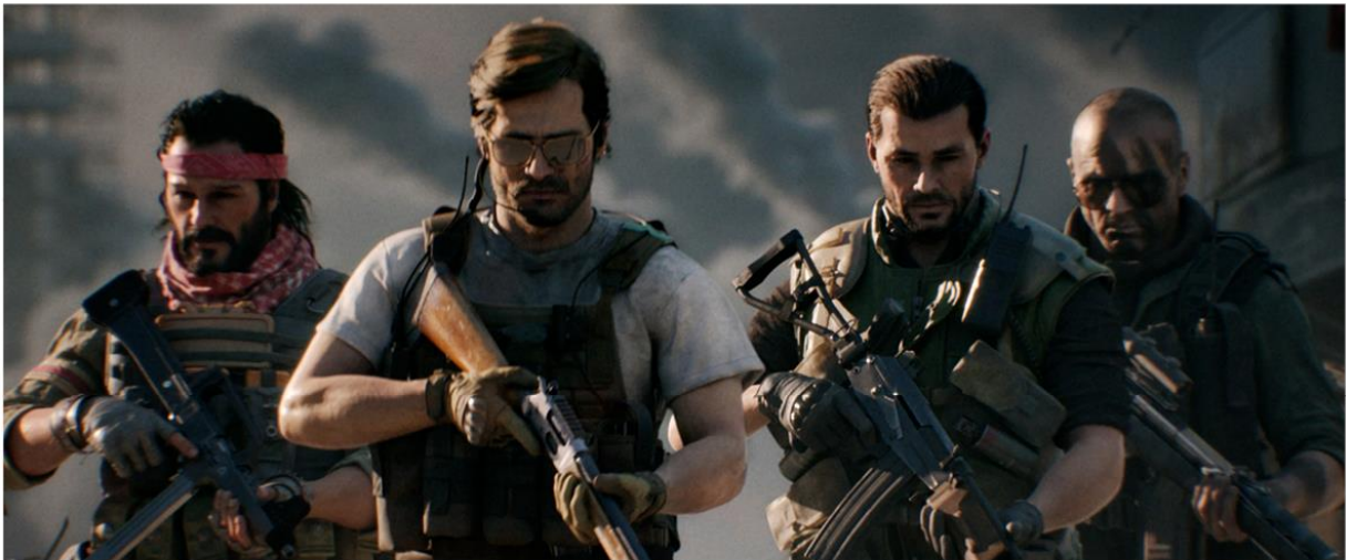
CALL OF DUTY®: BLACK OPS COLD WAR & WARZONE™ | SEASON 6