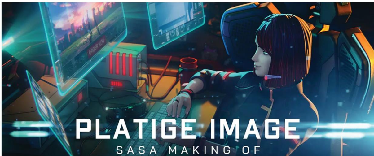
SASA | MAKING OF