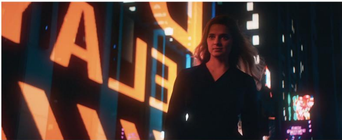
DEFECT | VIRTUAL SET