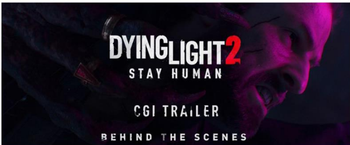
DYING LIGHT 2 | BEHIND THE SCENES

Link: youtu.be/G2xB_H6d-w | youtu.be/mI6A3xVqvSk