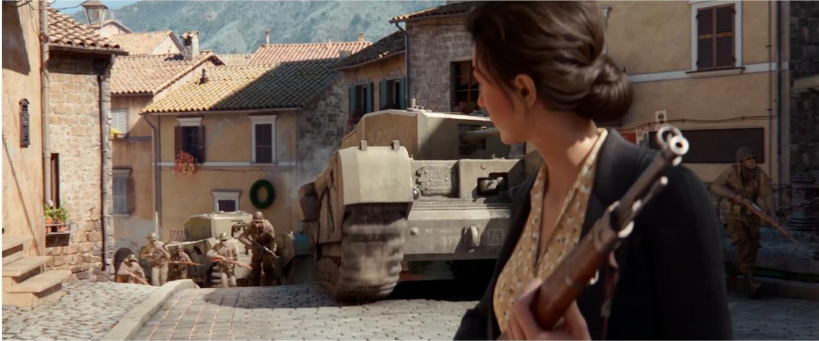
COMPANY OF HEROES 3