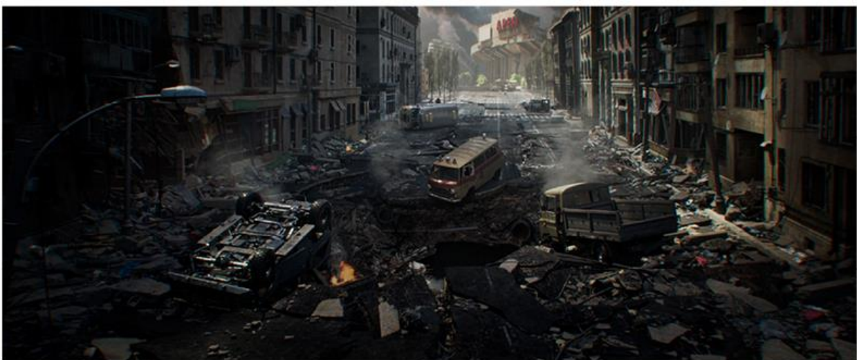
CALL OF DUTY: VANGUARD 1 & 2

Zespół Platige Image S.A. przygotował animację do dwóch sezonów gry Call of Duty: Vanguard , dystrybuowanej przez Treyarch Studios i Raven Software. Zwiastun wprowadza widzów w alternatywną rzeczywistość II Wojny Światowej. Gracze będą mogli nie tylko wziąć udział w największych historycznych bitwach, ale też zmierzyć się z zombie.