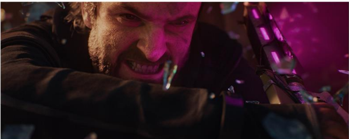
DYING LIGHT 2