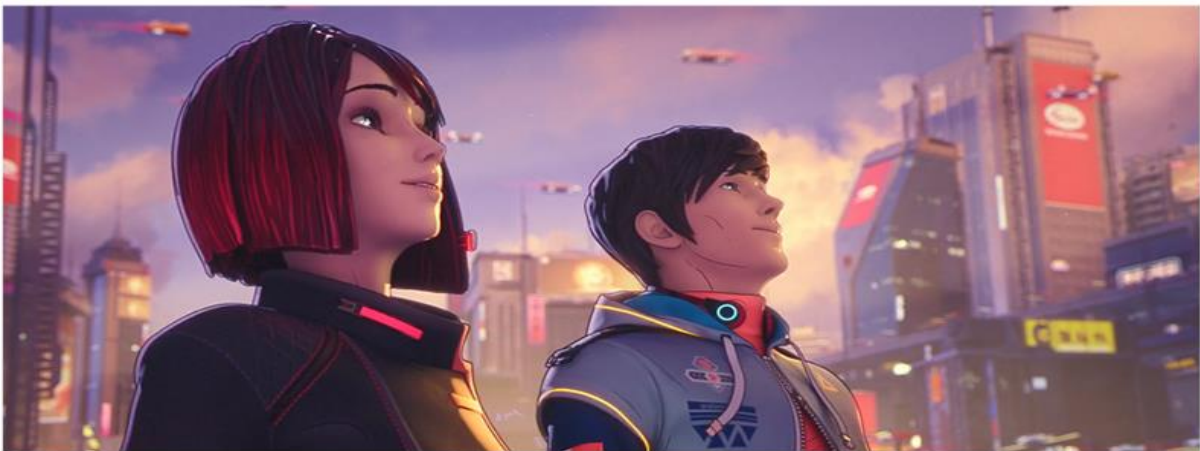
SASA | CYBERPUNK