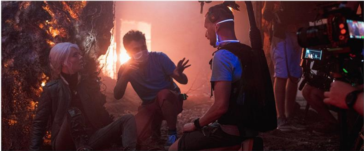
THE MEDIUM | MAKING OF