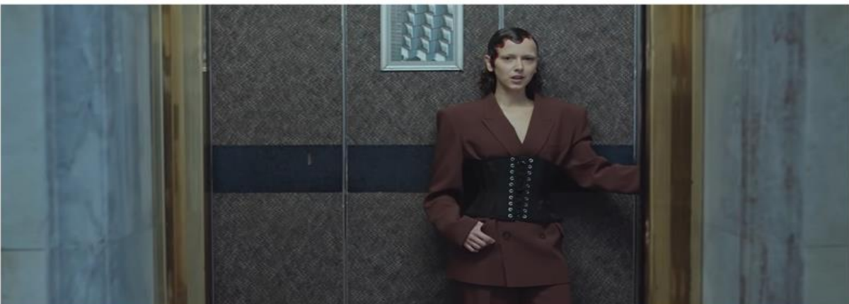
BRODKA | GAME CHANGE