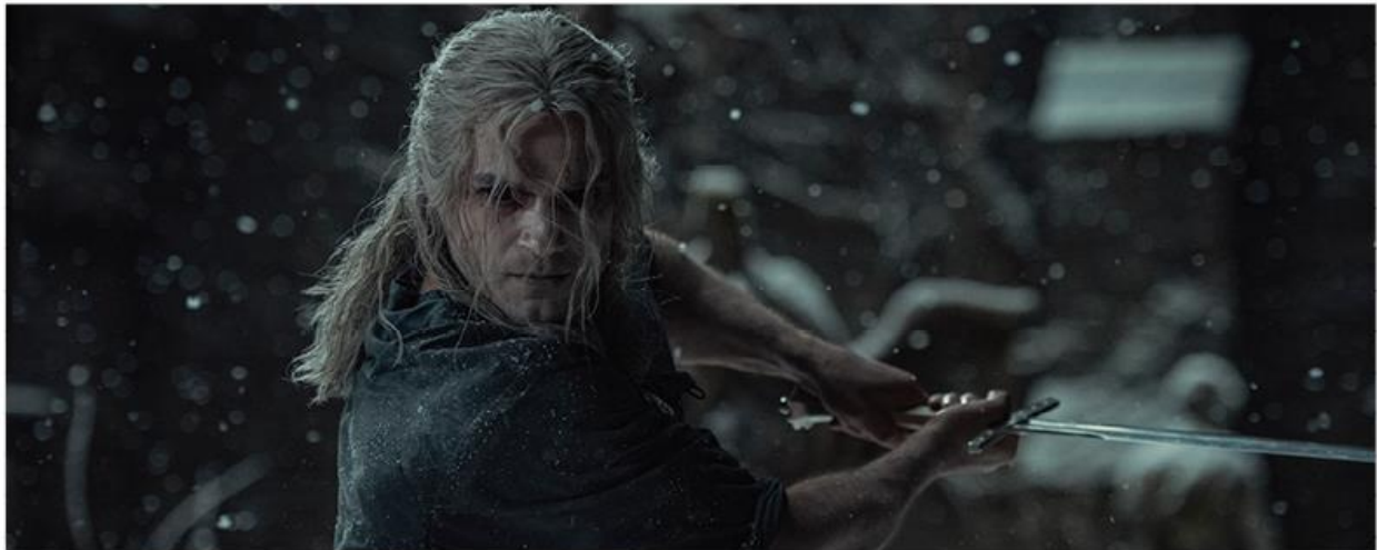
THE WITCHER | SEASON 2