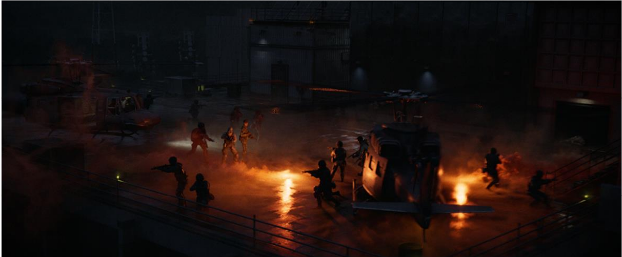
CALL OF DUTY®: BLACK OPS COLD WAR & WARZONE™ | SEASON 5