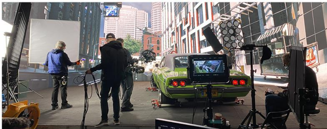
DEFECT | MAKING OF VIRTUAL SET