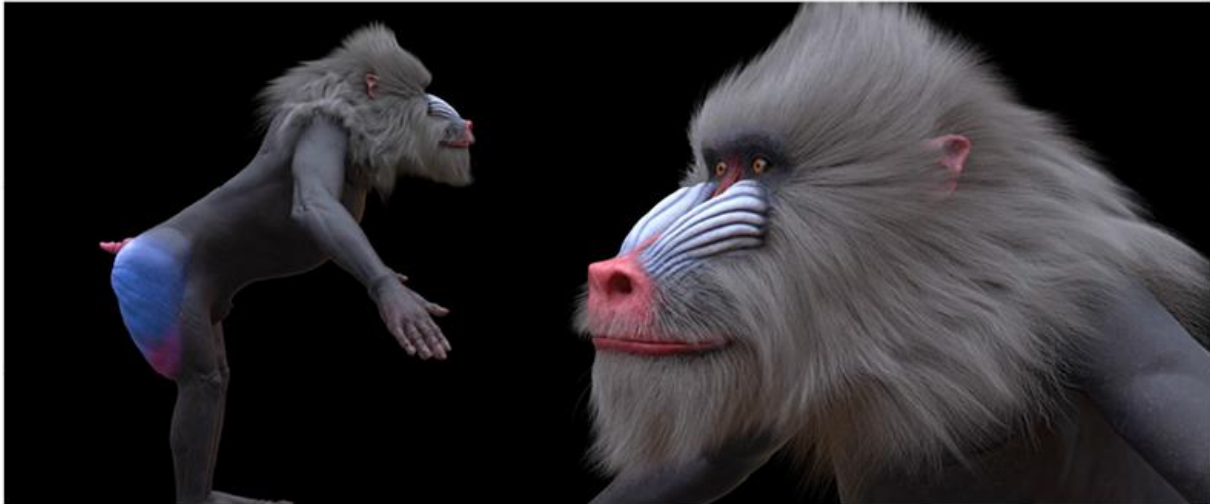
TAJAWAL – TRAVEL. BRING BACK YOU. | MAKING OF