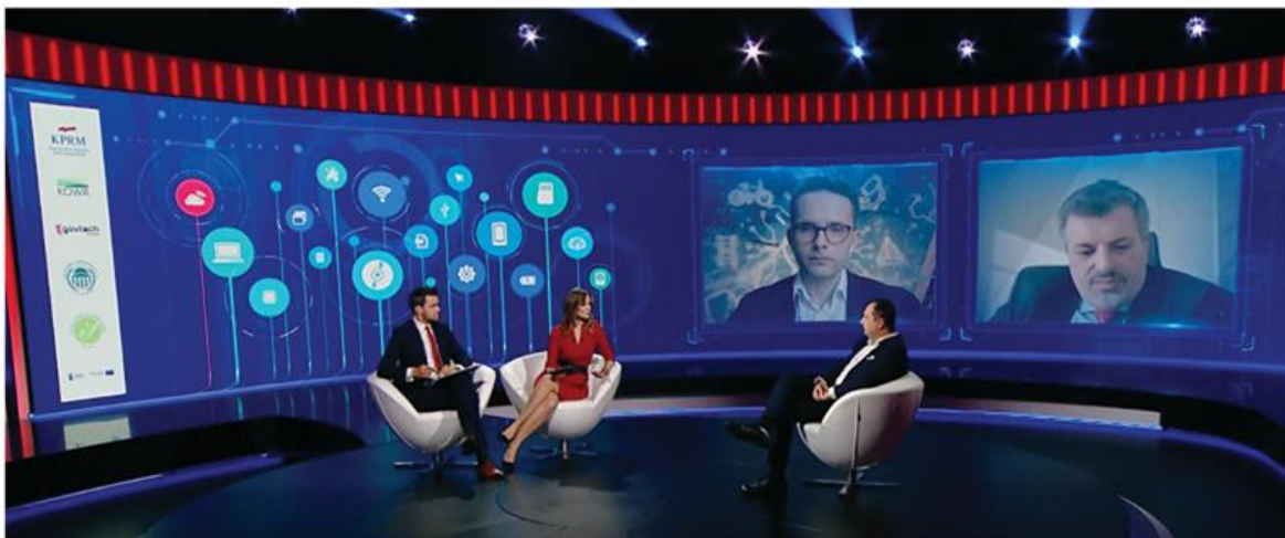
FORUM CYFROWEJ ADMINISTRACJI PUBLICZNEJ