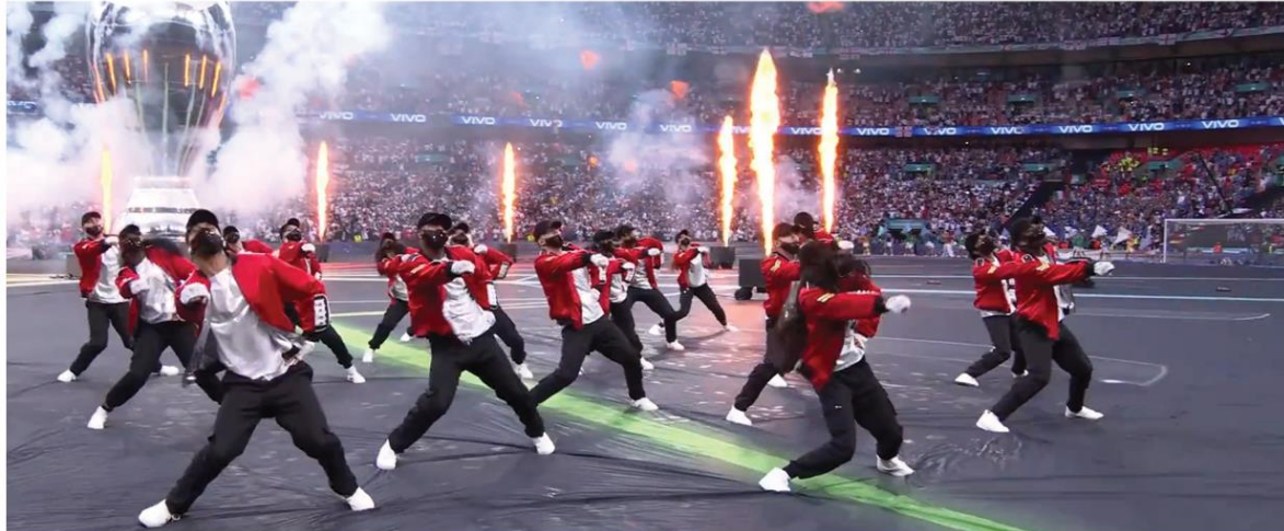
UEFA EURO 2020 | CEREMONIA ZAMKNIĘCIA

Platige Image S.A. była odpowiedzialna za grafikę AR podczas ceremonii zamknięcia finałowego meczu UEFA EURO 2020, między Włochami i Anglią. Oprawa została przygotowana we współpracy z londyńskim Events360, z wykorzystaniem technologii augmented reality i Spidercam. Wydarzenie odbyło się na stadionie Wembley w Londynie. To pierwszy projekt z użyciem technologii AR dla UEFA, przygotowany przez ekspertów Studia.