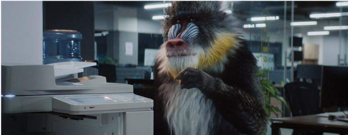
TAJAWAL | TRAVEL. BRING BACK YOU.