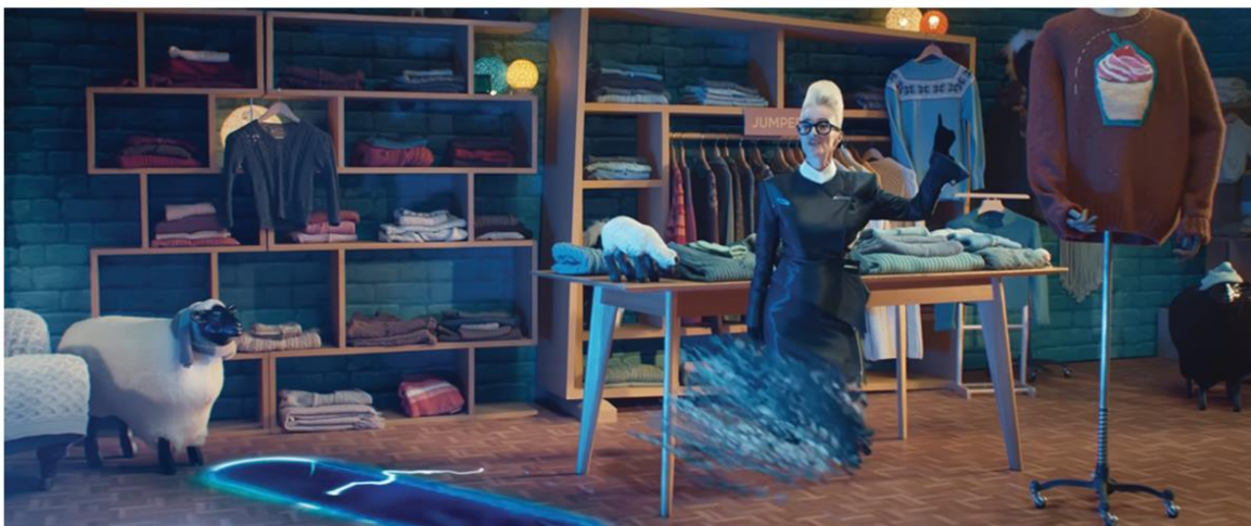
IONOS | I OWN THIS