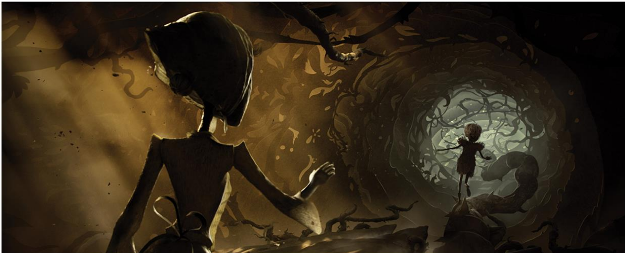
RESIDENT EVIL | VILLAGE