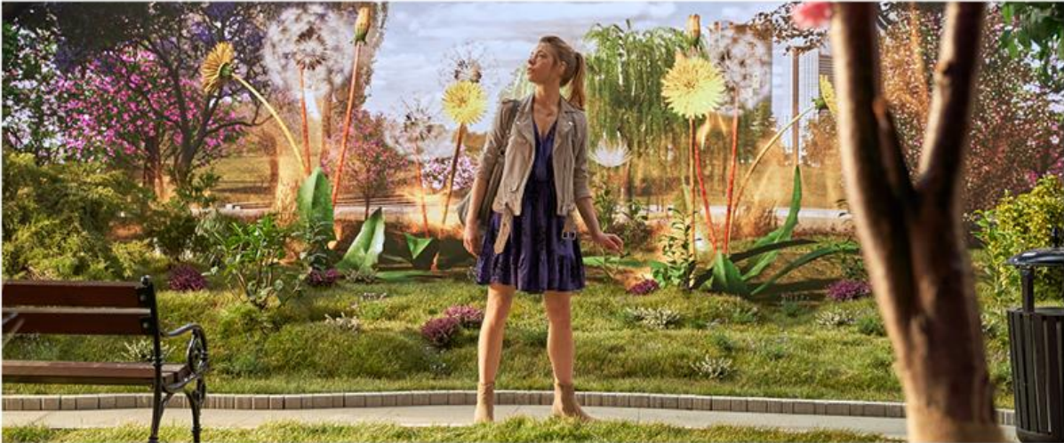
POLPHARMA | ALLERTEC FEXO